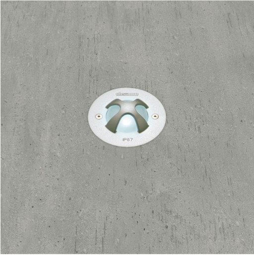
1638 Starled LED - A croce