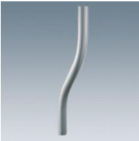
513 Brazo curvado para Aura