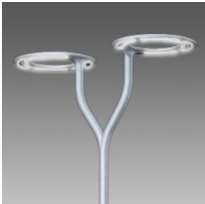
532 Brazo doble